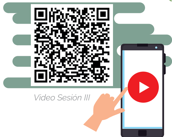
Video Sesión III