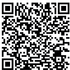
Video Sesión I