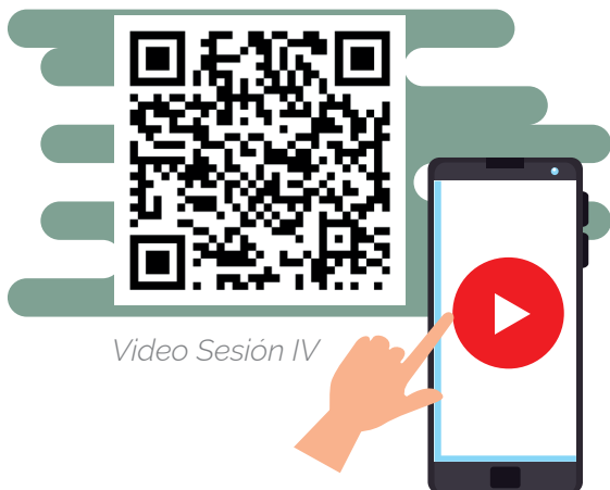
Video Sesión IV